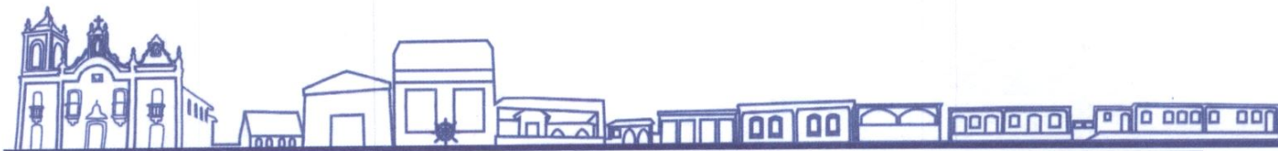
CLAUDIO LUCIANO DA SILVA XAVIER Prefeito Municipal

Gabinete do Prefeito, 14 de abril de 2015.