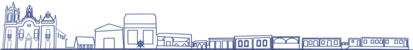
CLAUDIO LUCIANO DA SILVA XAVIER Prefeito Municipal

Gabinete do Prefeito, 18 de junho de 2014.